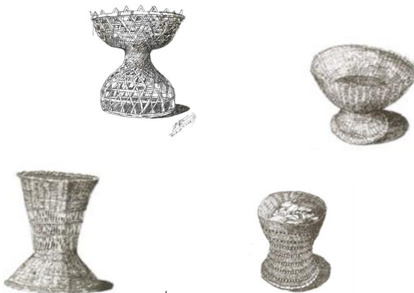
ภาพประกอบ

“ขันกะย่องของอีสาน” ยังมีเอกลักษณ์และความหมายแตกต่างกันมิติอื่นๆ เช่น ขนาดที่เล็กกว่า โดยมีเส้นผ่าศูนย์กลางประมาณ ๓๐ - ๔๕ เซนติเมตร และสูงตั้งแต่ ๓๕ - ๖๕ เซนติเมตร รูปทรงเส้นรอบนอกมีลักษณะแบบโบกคว่ำโบกงายแบบบัวปากพาน (ดูภาพประกอบ) วัสดุเป็นไม้ไผ่จักสานหลากหลายรูปแบบ (แตกต่างกับทางเหนือที่เป็นไม้จริง) มีลักษณะลายสานซึ่งเป็นแม่ลายสำคัญ เช่น ลายขัด ลายเฉลว ลายหัวส้อม ลายกันหอย คุณค่าทางศิลปะของ “ขันกะย่อง” ยังบ่งบอกถึงตัวตนคนอีสาน ที่สื่อสารผ่านงานช่างในแขนงต่างๆ ที่แสดงออกถึงวิถีชีวิตของสังคมเกษตรที่เน้นถึงความเรียบง่ายอีกทั้งสัจจะทางวัสดุ หรือเรียกอย่างภาษาชาวบ้านว่า “สวยแบบซื่อ ๆ”