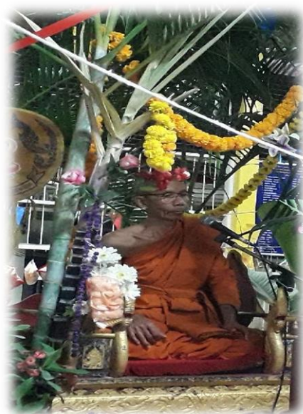
พระเศียรสังกาศเมื่อแห่ข้าวพันก้อนเสร็จ

เมื่อบูชาข้าวพันก้อนจบแล้ว หัวหน้าคณะผู้ถือถาดข้าวพันก้อน ตั้งนโม ๓ จบ ชุมนุมเทวดา คือ สักเค.....ไปจนจบ แล้วจึงกล่าวคำอาราธนาสังกาศ