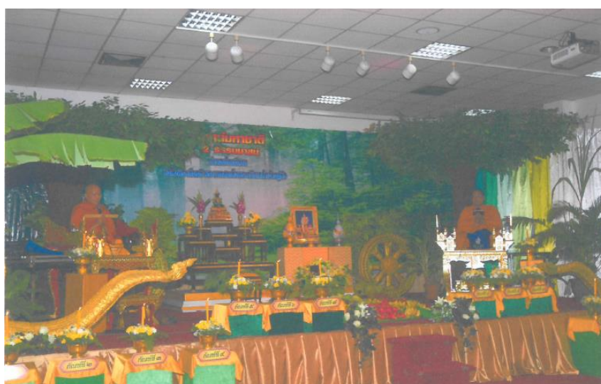
ภาพประกอบ